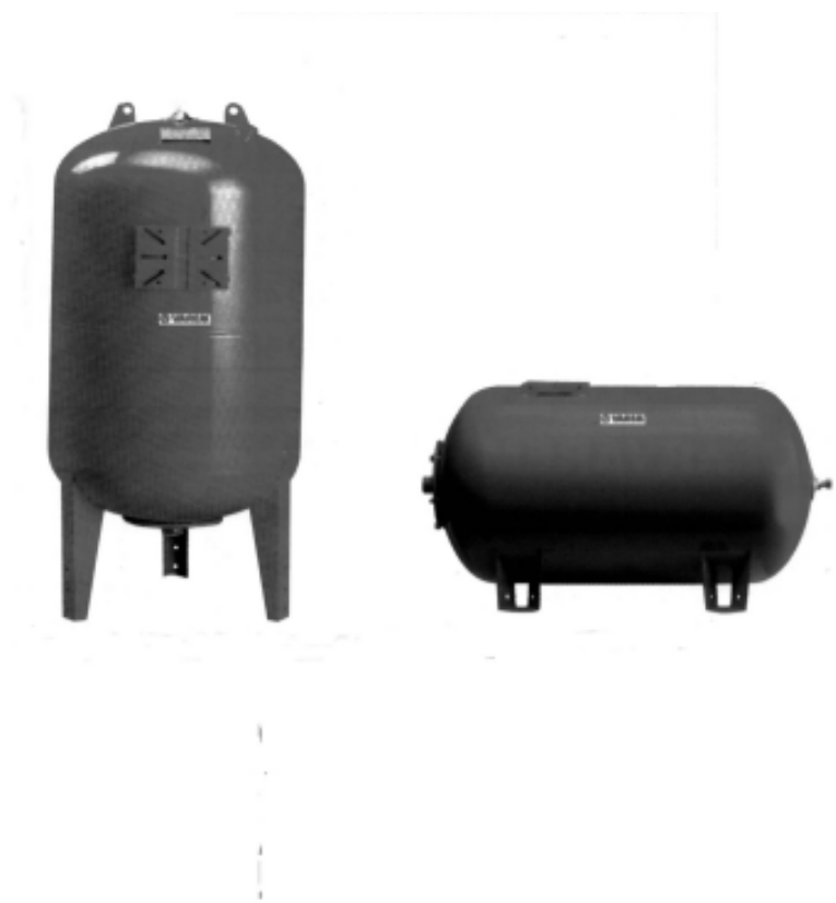
Гидроаккумулирующие мембранные баки серии LS